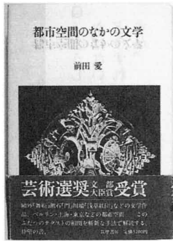
「都市空間のなかの文学」前田愛 筑摩書房