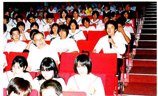
積極的に発言する中学生と高校生