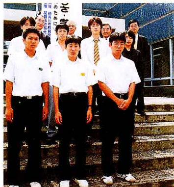
参加者と西澤学長