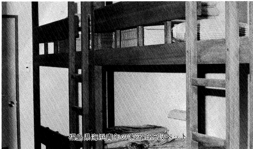
福島県海浜青年の家宿泊施設ベット