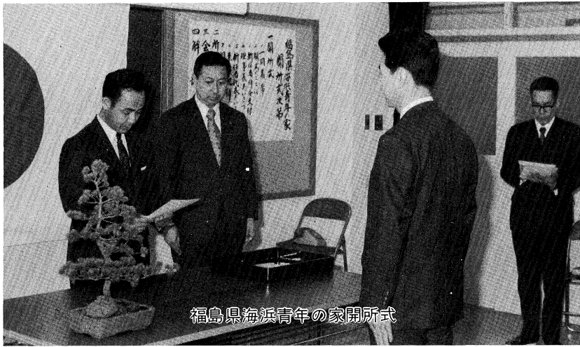
福島県海浜青年の家開所式