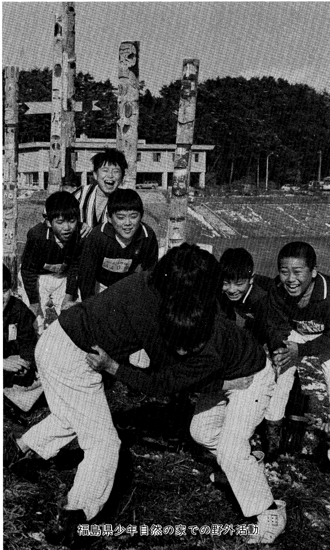
福島県少年自然の家での野外活動

いる。 利用者は、年々増加し四十九年度は四万七千余名にも達している。 本県では青少年教育施設の重要性と絶対数の不足から、それらの施設の設置促進が強く望まれていたところ、四月一日に、松川浦の恵まれた自然環境のなかに、福島県海浜青年の家を開所し、七月一日からオープンする。 今後広く青少年の活用を期待する。