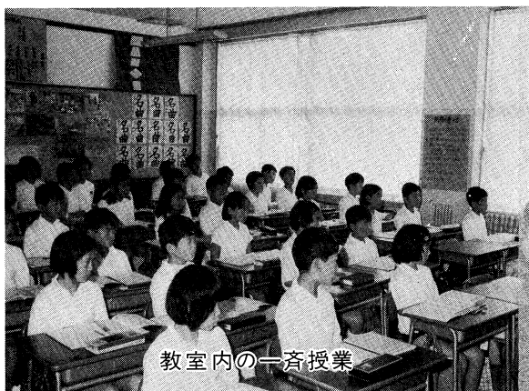
教室内の一斉授業

説と解説、各教科についての教材精選の考え方を内容とした特集を企画した。これからの教育は、いわゆる「詰め込み」にならないように、教材を精選して量的な負担を軽くし、ゆとりのある指導によって密度の濃い授業を展開することが望まれる。 要は、生がい教育の立場から、子供たちの自ら学びとる意欲を高め、ねばり強い学習習慣を育てることである。