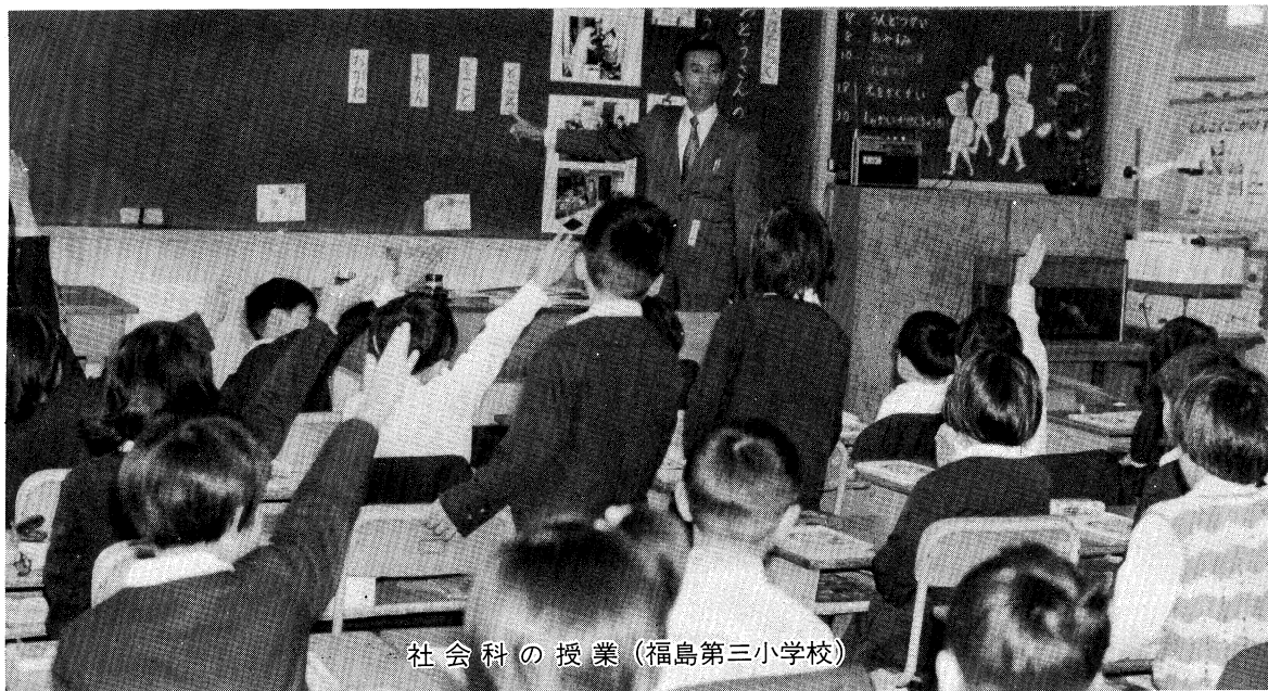
社会科の授業（福島第三小学校）