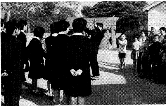
親のない子供のいる養護施設の慰問

昭和四十二年頃より、毎月一回、第三土曜日の午後には伺い、主に、おむつをたたんだり、衣類の補修をしたり、