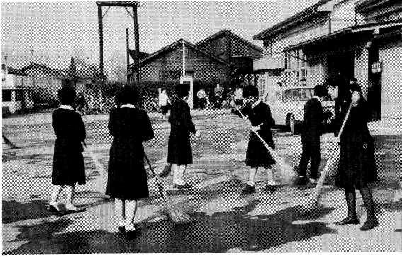
須賀川駅の清掃奉仕活動