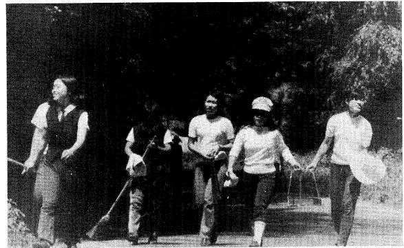
須賀川の名勝、牡丹園の清掃