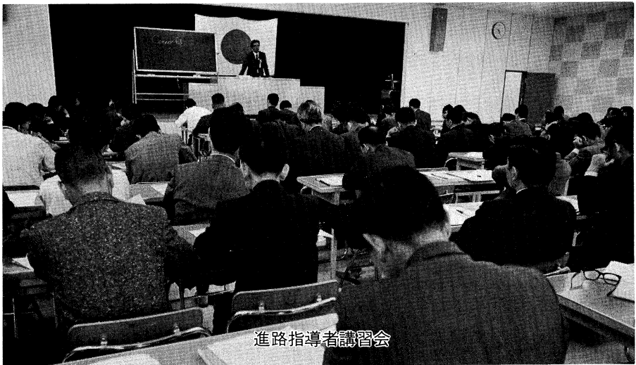
進路指導者講習会