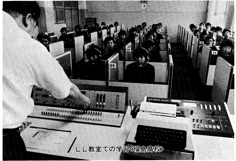
LL教室での学習 福島高校