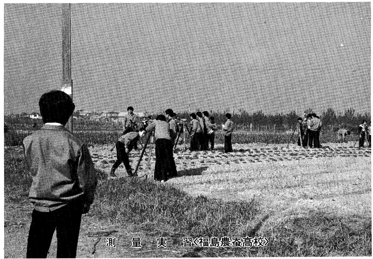
測量実習 福島農蚕高校