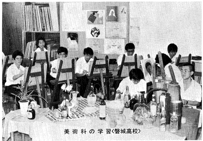
美術科の学習 磐城高校