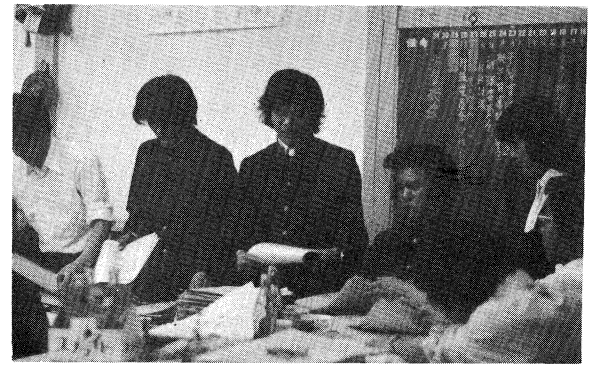
生徒会室での活動状況

わが校は奥久慈の上流に位置し、さわやかな緑の中に、改築なった白亜の校舎がそびえ立つ。校地拡張も実現し今秋には格技場も完成する。面目を一新した施設にふさわしい学習の場にするべく、「内容の充実」を教育方針の基本にすえて努力中。 普通科・男女共学は、近隣の中学のせん望の一つとなっているが、その魅力は活発な自治活動にあるとも言える。