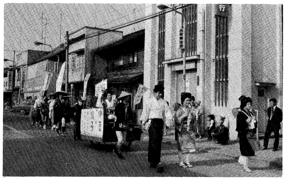
学校祭の仮装行列

遠足・球技大会・討論会・講演会・文化クラブ発表会……と生徒主催の行事も数多い。生徒会を中心とした各種実行委員会の活動はめざましく、本校の特色を示す。その活動を結集するのが三年に一度の学校祭、各種の展示・発表に加えて、町を練る仮装行列が呼び物で、職員チームまで参加する。 同一町内にある東白川農商高との交歓会は、他校には類のない独自のもの