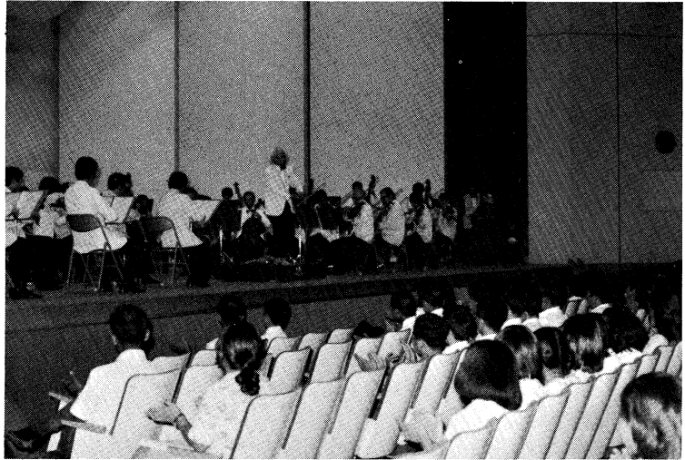
▲青少年芸術劇場（オーケストラ読売日本交響楽団）