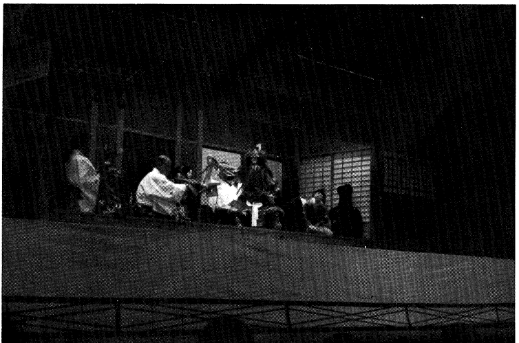
▲青少年芸術劇場（文楽 絵本太功記）