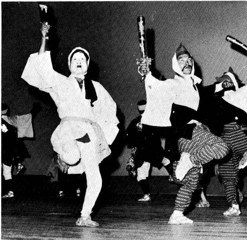
▲東北ブロック民族芸能大会（飯舘村比叢の田植踊り）

県民の文化需要にこたえる地域リーダー養成が進められた。 更にまた、特に多い本県文化財の保護について、市町村の熱心な努力で進展しており、東北新幹線建設に伴う遺跡の保護についても、関係者の協力のもとに着実に続けられている。