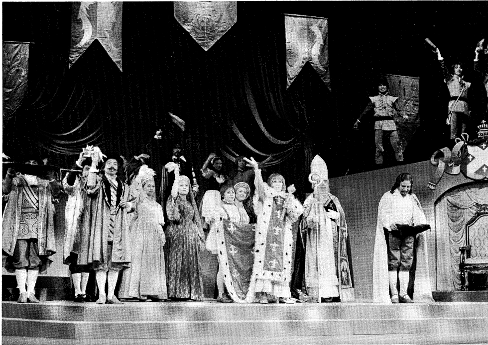
▲こども芸術劇場（ とほ 乞食と王子）

県民の文化需要にこたえる地域リーダー養成が進められた。 更にまた、特に多い本県文化財の保護について、市町村の熱心な努力で進展しており、東北新幹線建設に伴う遺跡の保護についても、関係者の協力のもとに着実に続けられている。