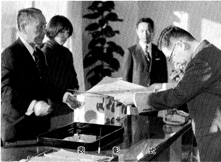
表 彰 式