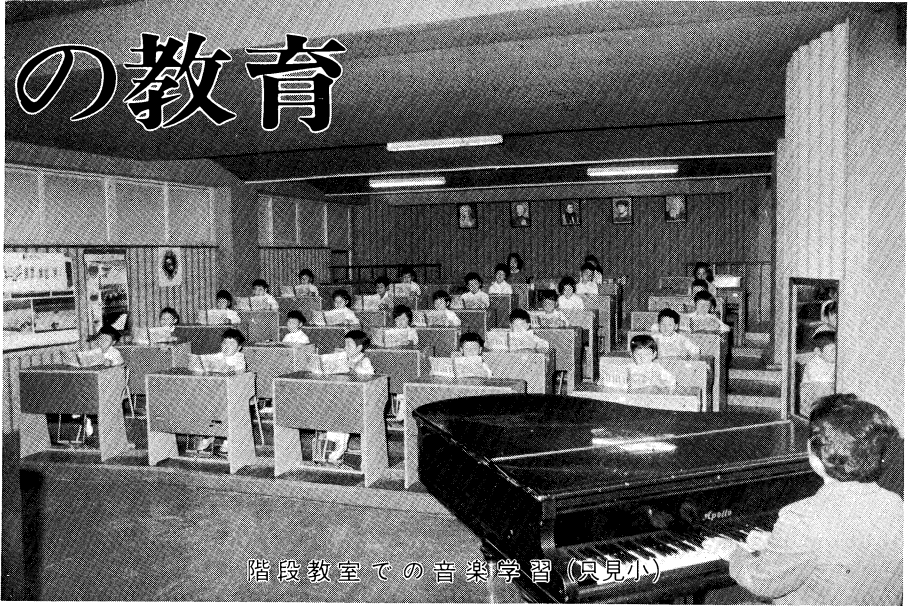
階段教室での音楽学習（京見小）