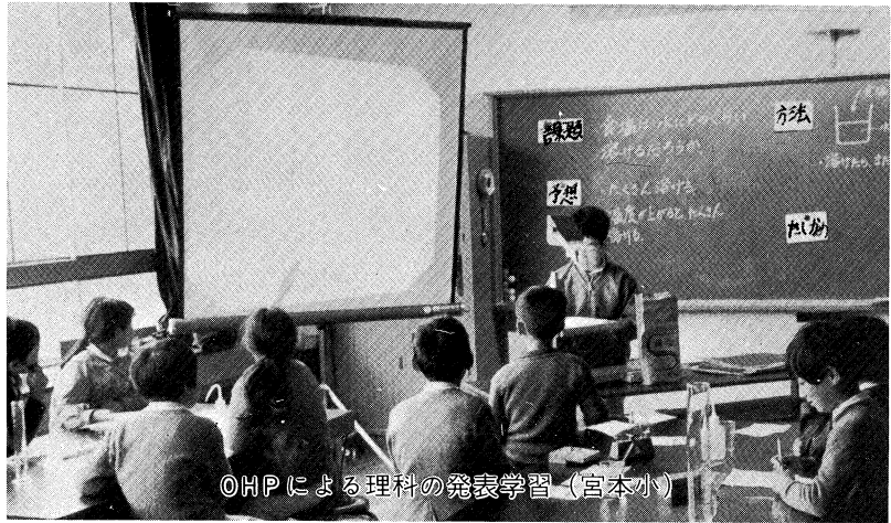
OHPによる理科の発表学習（宮本小）

本県の教育は、昭和四十一年度にスタートした第一次長期総合教育計画（昭和五十年まで）により大きな発展を遂げてきました。特に、幼児教育、芸術教育、科学教育、特殊教育はすぐれた実績を築いてきました。また、教育センターを柱とする教職員研修も年々充実し、開設講座数では、全国的にも多く、内容も充実しています。現在、第二次福島県長期総合教育計画（昭和六十年まで）の策定作業が進行中