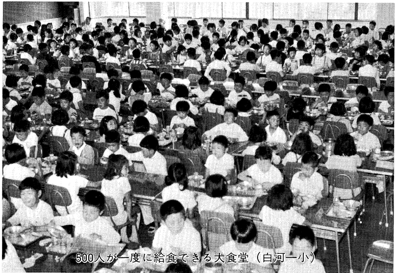
500人が一度に給食できる大食堂（白河一小）

本県の教育は、昭和四十一年度にスタートした第一次長期総合教育計画（昭和五十年まで）により大きな発展を遂げてきました。特に、幼児教育、芸術教育、科学教育、特殊教育はすぐれた実績を築いてきました。また、教育センターを柱とする教職員研修も年々充実し、開設講座数では、全国的にも多く、内容も充実しています。現在、第二次福島県長期総合教育計画（昭和六十年まで）の策定作業が進行中