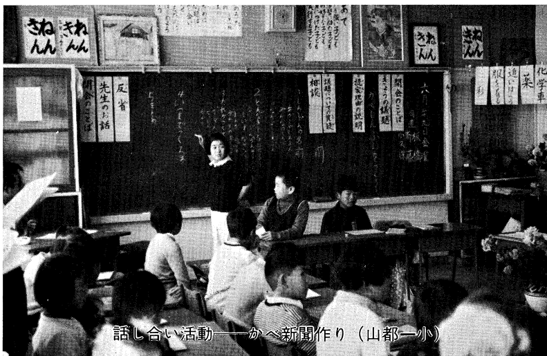
話し合い活動——かへ新聞作り（山都一小）