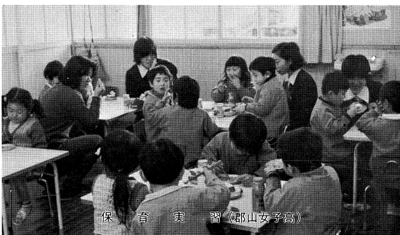
保 育 実 習（郡山女子高）

て、常に人間性を失わず、自他の敬愛と国 際的な広がりをもった、豊かな「心」と、 創造性・適応性に富んだ児童生徒の育成に 向けて努力がなされています。 今後とも、児童生徒には、更に自主的な 学習を多く経験させ、自ら学びとる力を育 てていくとともに、「人生への意味」の理解 もいっそう深めていくことが必要と思われ ます。