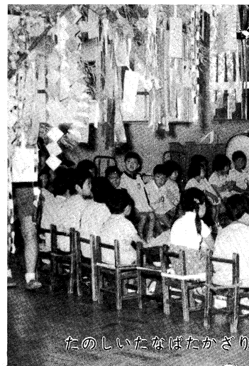
たのしいなばたかざり