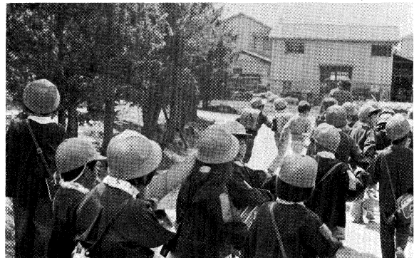
(交通のルールを守り安全に退園する)