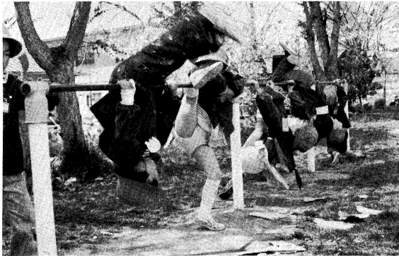
(元気に力いっぱいあそぶ)

ア 交通・水難・火あそびなどの事故防止に対しては、園・家庭・地域が連携し、協力体制をとっている。