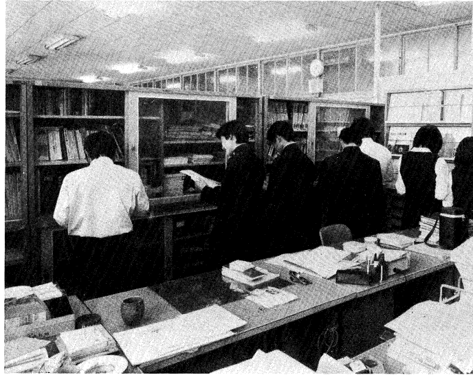
進路指導室での求人情報の研究（田村高校）

そのためには、正しい進路情報の提供と教育相談を充実していくことが特にたいせつであろう。