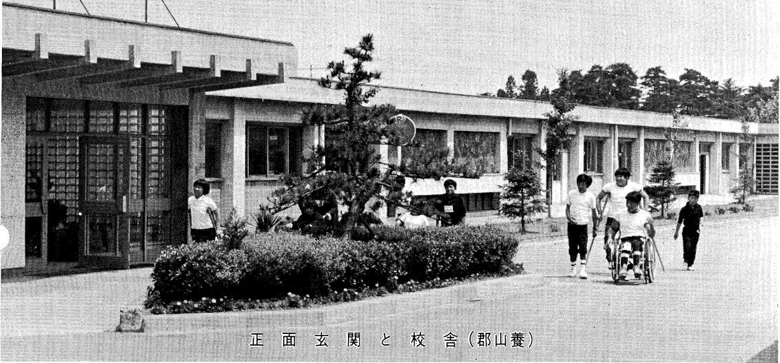
正面玄関と校舎(郡山養)

特殊教育は、人間尊重の精神と、教育の機会均等の理念に立脚して行われている。 本県の特殊教育諸学校数・特殊学級数は全国的にも多く、施設・設備も、計画的に整備が進んでいる。 また、障害の種類・程度に応じて、適正な教育が受けられるよう、県及び市町村に、心身障害児就学指導委員会