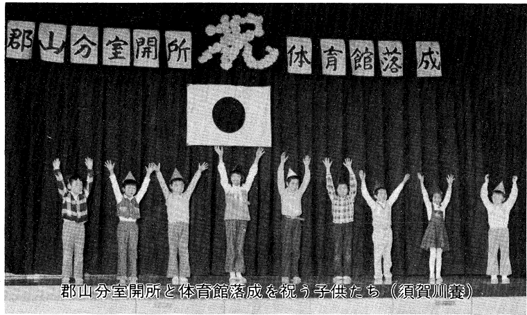
郡山分室開所と体育館落成を祝う子供たち(須賀川養)

特殊教育は、人間尊重の精神と、教育の機会均等の理念に立脚して行われている。 本県の特殊教育諸学校数・特殊学級数は全国的にも多く、施設・設備も、計画的に整備が進んでいる。 また、障害の種類・程度に応じて、適正な教育が受けられるよう、県及び市町村に、心身障害児就学指導委員会