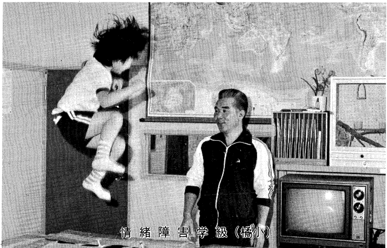
情緒障害学級(橘小)