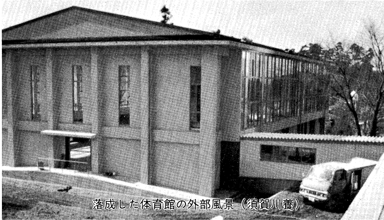
落成した体育館の外部風景（須賀川養）

の設置が進められている。 昭和五十四年度より、養護学校の義務制施行に向けて、今後更に、障害の種類・程度に応じた指導内容の充実と施設・設備の拡充整備を図るとともに有能な教員の確保に努め、「明るく、正しく、たくましい」児童生徒を育てていきたい。