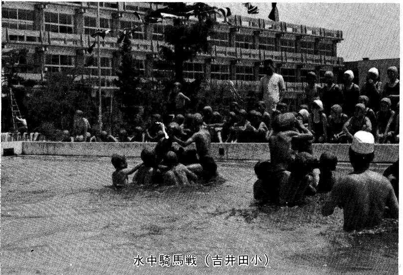
水中騎馬戦 (吉井田小)