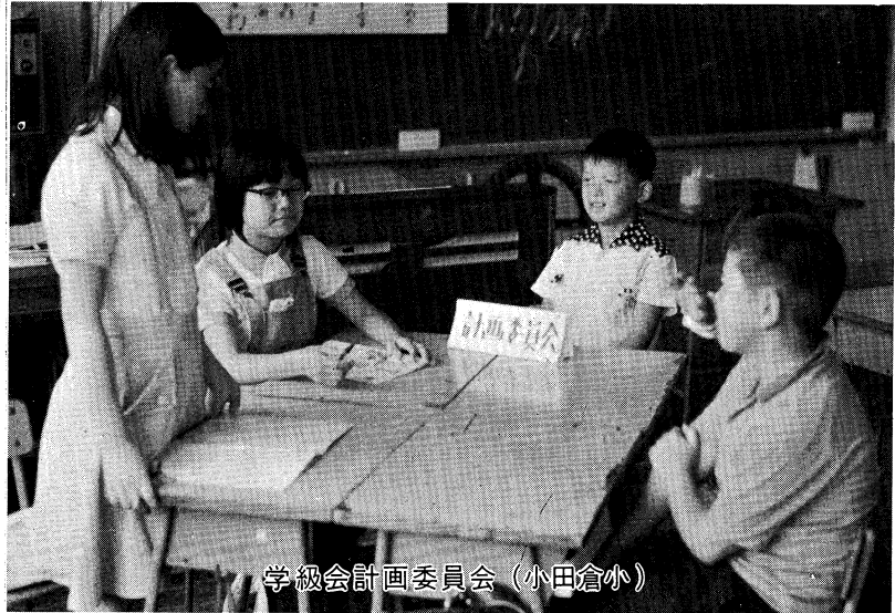
学級会計画委員会 (小田倉小)