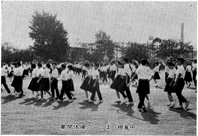
業間体操の一こま (棚倉中)

すべての児童生徒がそれなりに毎日充実感を持ち、生き生きとした学校生活をするよう念願しながら、教師は日々の教育指導をつづけております。 そのためには、「教材内容の精選」によって基礎的・基本的内容を明らかにし、児童生徒の能力・適性に応じて「学習指導の最適化」を図るため、じゅうぶんな配慮が望まれます。その中で、発達段階に応