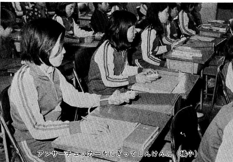
アンサーチェッカーをにぎってしんけん (橘小)

じて、児童生徒が自ら目標を定め、計画をたて、成就の喜びを得られるような場面の設定をし、積極的に援助指導をしていくことが重要となります。 こうした指導は、単に知的な学習内容のみにこだわることなく、豊かな情操を高め、創造性を養う教育活動、健康で安全な生活を営む態度の育成、道徳教育や特別活動の指導など、学校教育のすべての場面で、学校の全教職員による積極的な協力指導が重要となります。