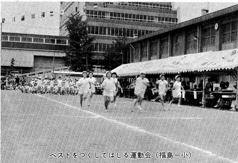
ベストをつくしてはしる運動会 (福島一小)

じて、児童生徒が自ら目標を定め、計画をたて、成就の喜びを得られるような場面の設定をし、積極的に援助指導をしていくことが重要となります。 こうした指導は、単に知的な学習内容のみにこだわることなく、豊かな情操を高め、創造性を養う教育活動、健康で安全な生活を営む態度の育成、道徳教育や特別活動の指導など、学校教育のすべての場面で、学校の全教職員による積極的な協力指導が重要となります。