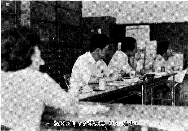
校内ブロック研究会 (小田倉小)