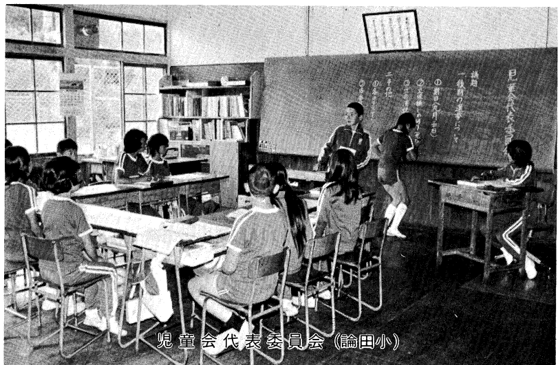
児童会代表委員会（論田小）