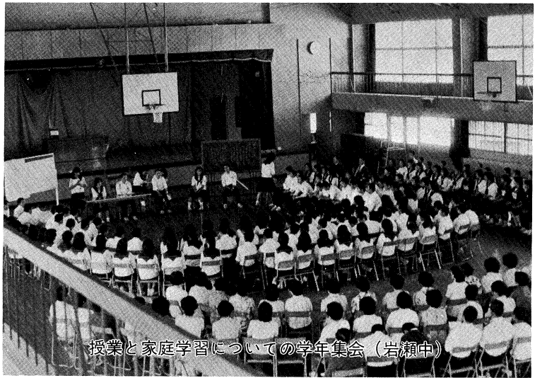
授業と家庭学習についての学年集会（岩瀬中）