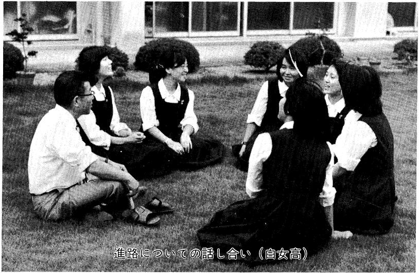
進路についての話し合い（白女高）

生徒指導は、すべての児童生徒を対象とし、一人一人を理解し、それぞれの人格を尊重し、それぞれの能力・適性・社会的資質の伸長を図るための総合的教育活動である。 非行生徒や学業不振児童に対しては、問題のない者に対するよりも、より多くの指導や援助が行われなければならないことは言うまでもないことである。しかし、生徒指導の本旨はすべての児童