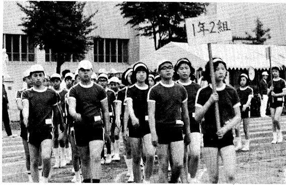
(生徒会主催の陸上記録会)

本校は、昭和四十八年度より、市の教育課程研究指定校となり、「学習効果を高めるための各教科の指導の重点化」の研究をすすめてきた。 各教科の年間計画の改善をすすめることを主要な研究課題として取り組む次の観点により、教材の精選、指導の重点化を図っている。 1、各教科・領域の目標・内容と本校の教育目標 2、基本的事項の系統や関連