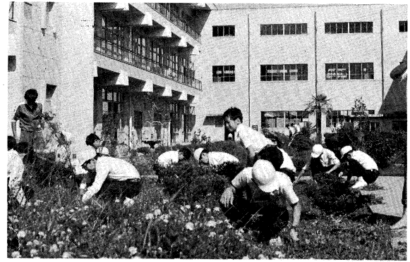
(緑化委員による花だんの手入れ)

本校は、昭和四十八年度より、市の教育課程研究指定校となり、「学習効果を高めるための各教科の指導の重点化」の研究をすすめてきた。 各教科の年間計画の改善をすすめることを主要な研究課題として取り組む次の観点により、教材の精選、指導の重点化を図っている。 1、各教科・領域の目標・内容と本校の教育目標 2、基本的事項の系統や関連