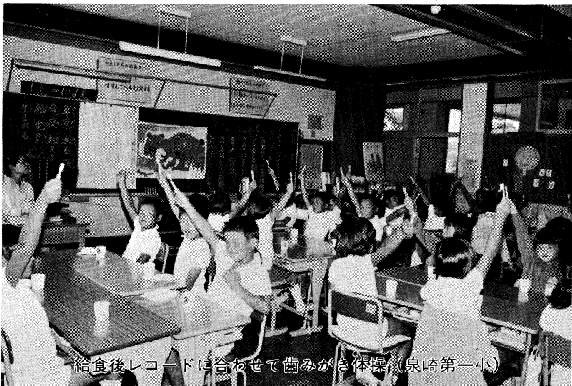
給食後レコードに合わせて歯みがき体操（泉崎第一小）