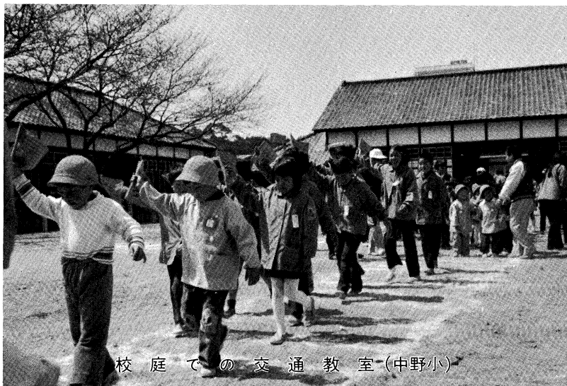
校庭での交通教室（中野小）

学校保健・安全については、学校教育全体の中で、それが占める位置・性格・目標を正しく考える必要がある。また、学校における保健・安全の直接の対象は児童生徒なので、児童生徒の欲求や興味を探ることとたいせつである。そのうえで、学級や学校の実態に応じたカリキュラムを具体的に定めるべきである。特に健康診断の結果に基づき、継続的な観察と指導の徹底