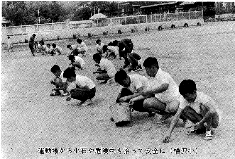
運動場から小石や危険物を拾って安全に（檜沢小）