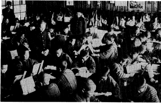
昭和5年3月清水代用附属校授業風景