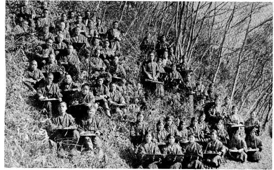
昭和5年福浦小学校高等科生の野外写生