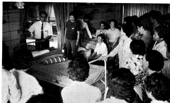
喜久田婦人学級の合同宿泊研修（磐梯青年の家）