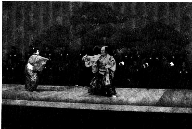
青少年芸術劇場 (長唄連獅子)