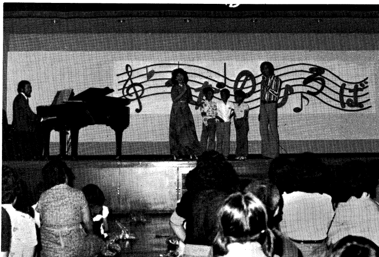
家庭劇場 (うたのひろば)