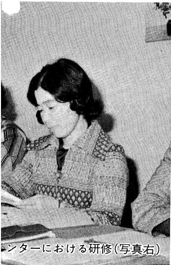
センターにおける研修(写真右)