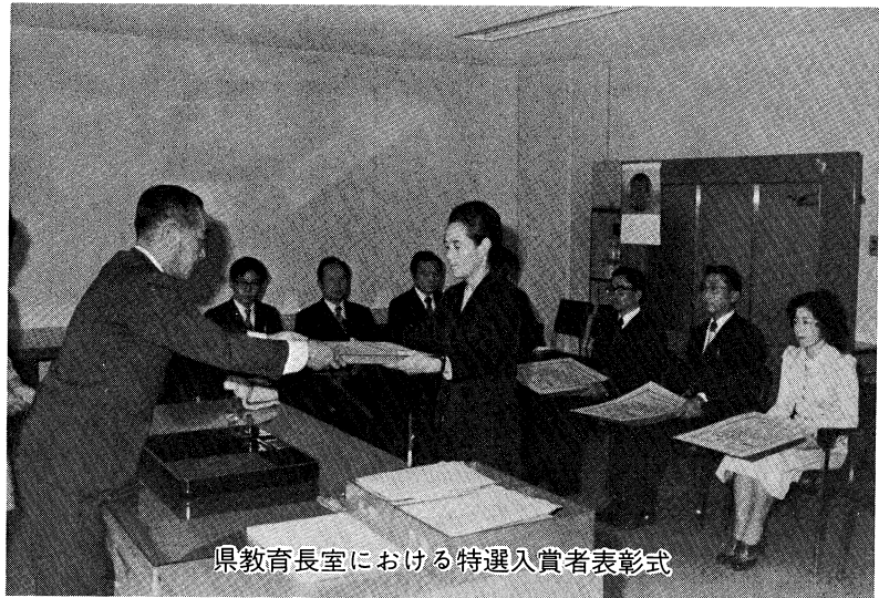
県教育長室における特選入賞者表彰式