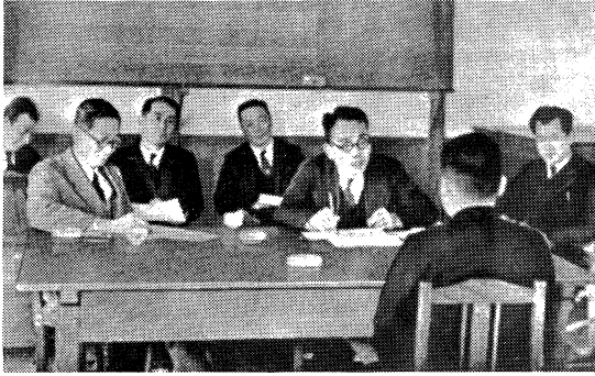
新任校長採用のための面接（昭和25年）