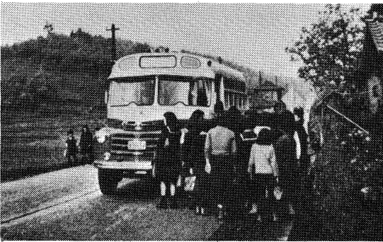
学校統合によりバス通学する福島一中生(昭和31年)