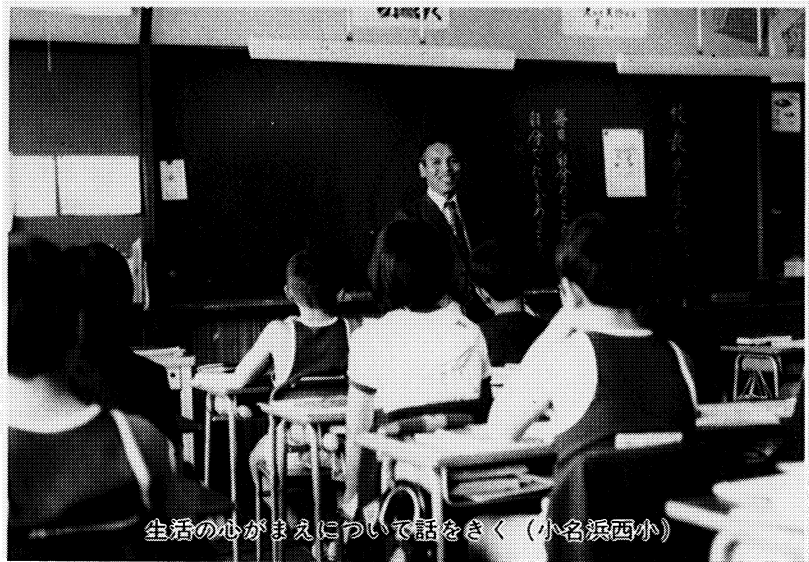
生活の心がまえについて話をきく (小名浜西小)

児童生徒にとって、学校はたいせつな生活の場です。 学校における基本的な指導理念として、どの子ども人間としてたいせつにされ、どの教師も児童生徒に対して温かい教育愛をもって接することが必要です。 生徒指導は、この基本的理念をふまえて、教員指導において、集団指導場面において、さらに教