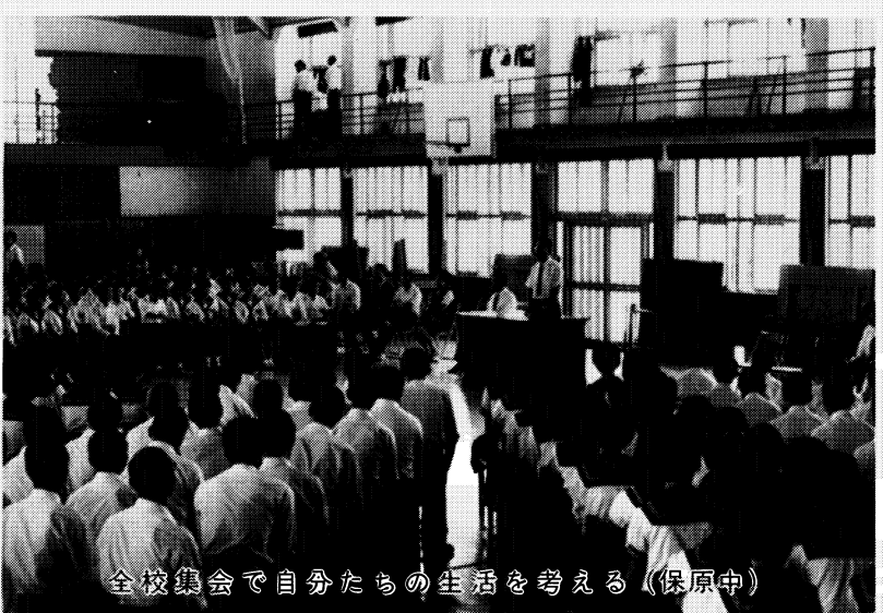
全校集会で自分たちの生活を考える (保原中)