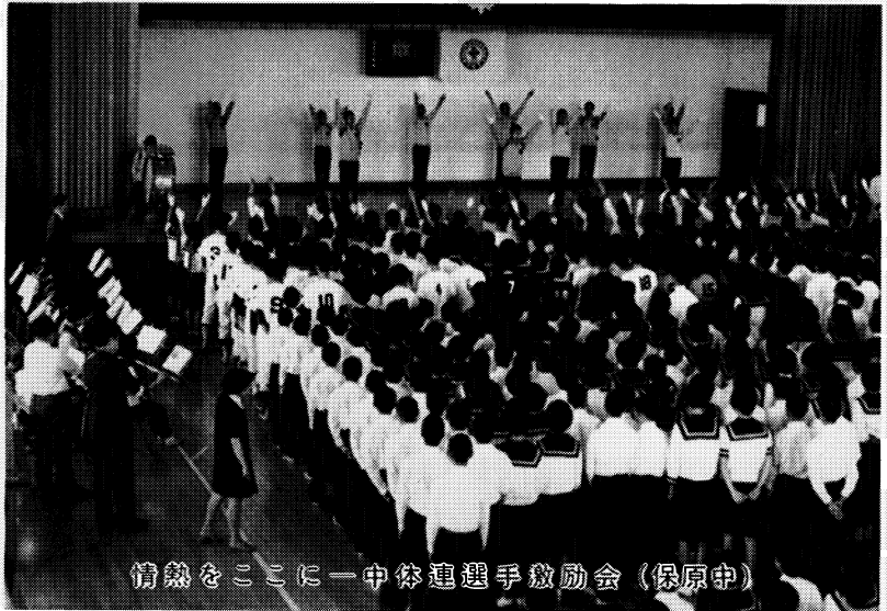
情熱をここに一中体連選手激励会 (保原中)