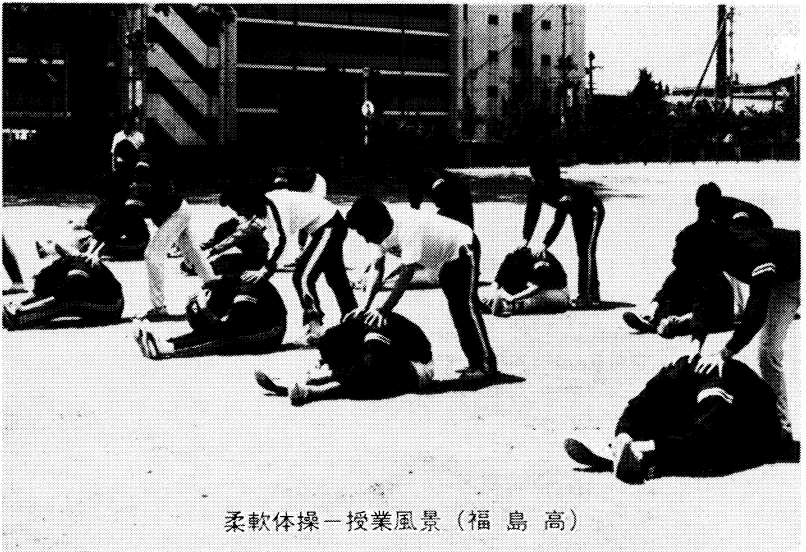
柔軟体操—授業風景 (福島高)