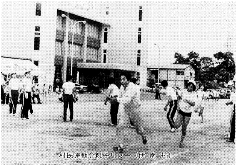
村民運動会親子リレー (伊南村)