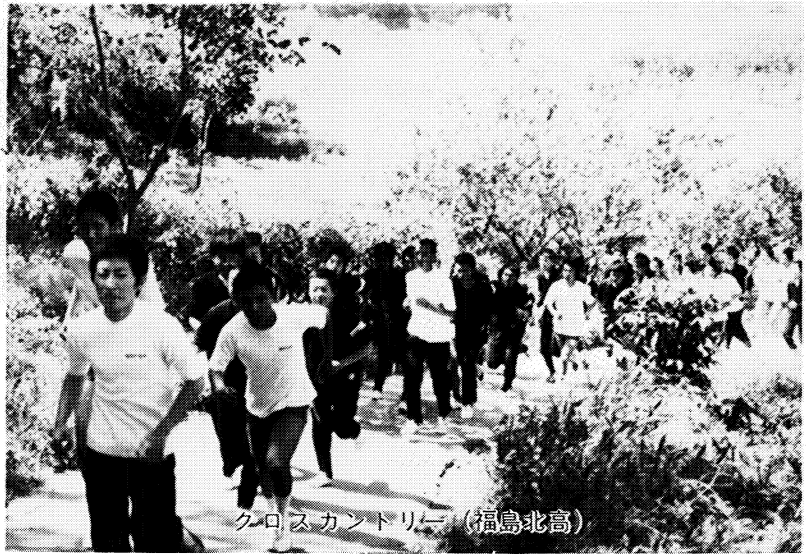
クロスカントリー (福島北高)