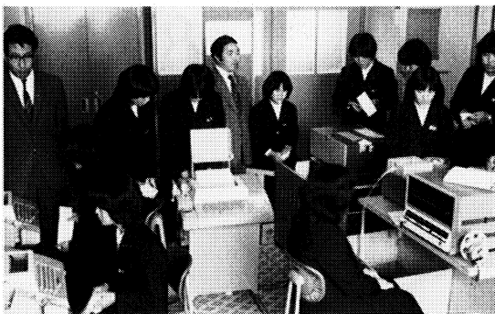
未来のプログラマーをめざして

積極的な摂取に取り組んでおります。またクラブ活動はもとより、部活動の中にも生きがいを見いだし、特に歴史と伝統を誇るボート部、輝かしい記録をもつ和文タイプ、カナタイプは本校の最も誇りとするものです。 居は気移すといわれますが、校舎がきれいで清掃が徹底していることも特徴の一つで、週番活動の励行―このような実践は、学園の美化ばかりでなく、全校生による雄国沼一帯のゴミ拾い運動となつてあらわれております。先輩と、教師と、そして良き友と、教育理念を全人教育におき、個性豊かにして誠実有能な産業人の育成は、このような中でますます育っております。