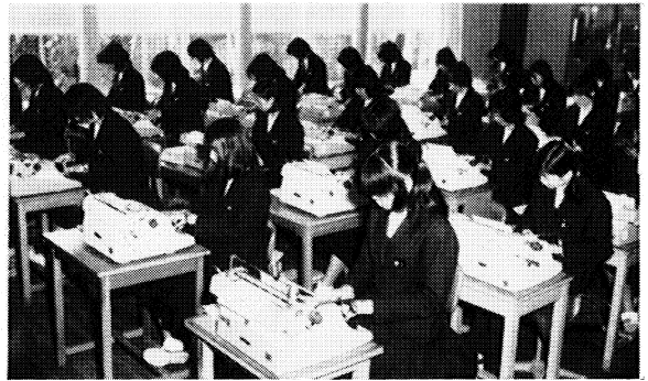
カナタイプ授業風景

士魂商才二つを兼ねて、大正三年に町立喜多方商業補習学校として創立、大正十一年福島県喜多方商業学校として認可され、本格的に、地域社会の産業後継者育成を目的とした学校として発展してきました。現在は、商業科各学年三学級、事務科各学年二学級の計十五学級の適正規模を誇り、卒業生も七千名を越え、地元はもとより京浜方面でも多数活躍している現状です。 西北仰ぐは靈山飯豊、峻嶺磐梯東に望む(校歌)すばらしい自然環境に恵まれたもて、多感な青春時代を過ごす若者たちは、学習面では、社会的要請と商業教育の体質改善を旨とし、ミニコンピュータによる情報処理教育の