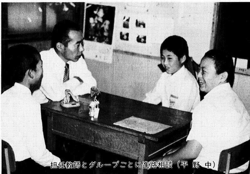
担任教師とグループごとに進路相談（平野中）