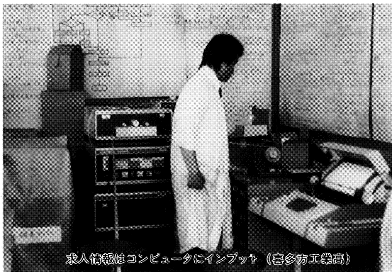
求人情報はコンピュータにインプット（喜多方工業高）

このような指導は、それぞれの学校において、あらゆる教育活動の場をとおして、組織的・継続的に行われています。 学級活動やホームルームでの話し合い、先生との定期相談、進路指導室での情報や資料の研究、勤労体験的な学習や家事作業への協力など——生徒たちは真剣に取り組んでいます。