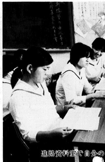
進路資料室で自分の