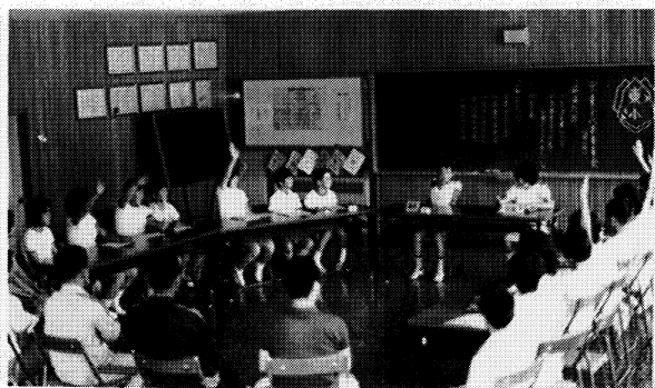
活発な代表委員会

校歌の一節に『恵もひろき久慈川のほとりにたてる東館』とある。中通りの最東南端に位置し、四季を通じて美しい景観に囲まれた丘のうえに、百余年の歴史をもった東館小学校がある。近代的な鉄筋校舎に暖房が完備されて一年中快適な学校生活がおくれる。この恵まれた環境で生活する児童は、明るく素直でのびのびと活動しているが、反面創意くふうをこらしねばり強く、最後までがんばりぬくといった気力に乏しく、依存心が強いなどの問題点をも