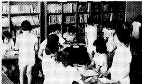
図書委員会の貸し出し風景

力し、その結果、児童会活動ばかりでなく清掃活動等にも成果が現われてきている。 更に、五つの教育目標の中核である『心も体も健康な子供の育成』については、毎日の業間活動で体力の向上、情操の高揚といった視点から持久走、全校ダンス、音楽活動などを週プログラムの中に位置づけ、児童一人一人にそして、グループに、また全体に具体的な目あてをもたせて実践している。