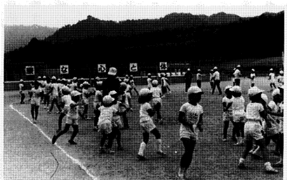
業間活動(ダンス)のようす

このような実態から本校の教育目標の重点を『創造性豊かな実践力のある子供の育成』において、過去二年間学級会活動(話し合い活動・係活動)を中心に児童活動のあり方について究明してきた。本年度は、その第三年次でもあり、この課題解決の年として、研究を全校の児童会活動に広げ、代表委員会、各種委員会、集会活動をとおして創造性豊かな実践力をもった子供たちを育てるべく全職員一丸となつて努