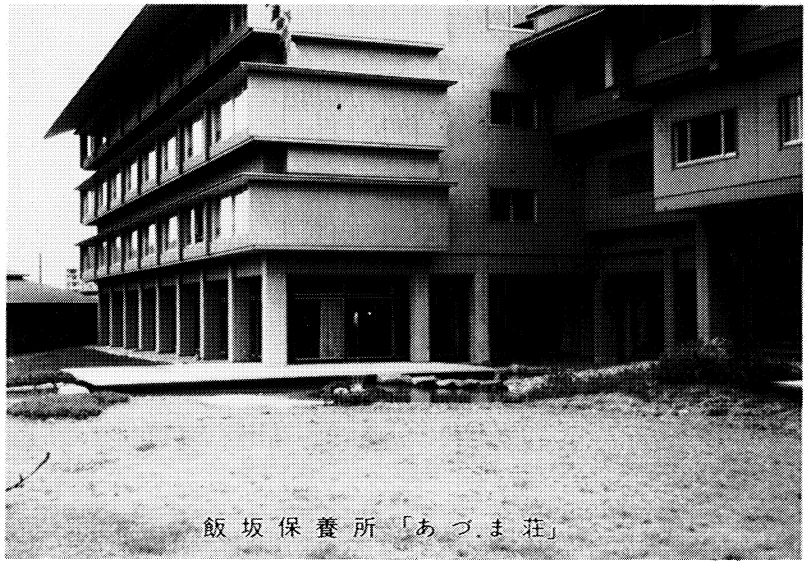
飯坂保養所「あづま荘」