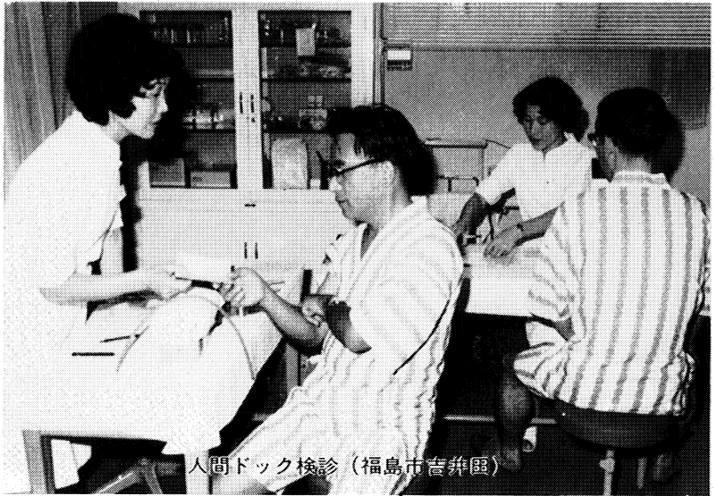
人間ドック検診（福島市吉井区）

福利厚生事業は、教職員の皆さんとその家族が、職場でも家庭でも、安心して楽しく働きながら、健康で文化的な生活が送れるよう 日常の生活に密着した諸施策であります。