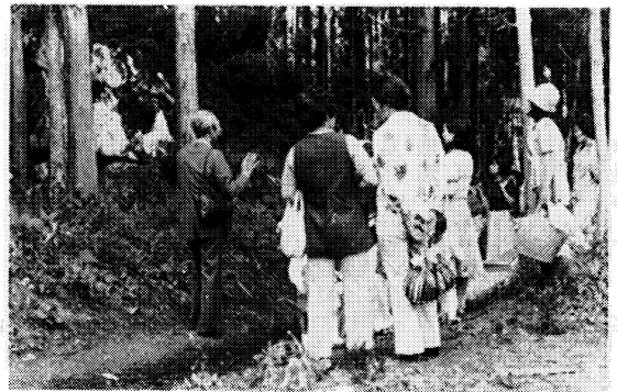
町内文化財めぐり（鴨山城跡をたずねて）

一、はじめに 田島町の乳幼児家庭教育学級は、昭和四十九年度から県補助学級として開設され、現在五十二年度は第四期目にあたる。町中央公民館において実施している本町唯一の乳幼児学級であり、対象は幼児（三歳児以上）を持つ母親とし、年間三十時間以上の学習会を計画している。 さて、当学級活動のなかで特色ある諸点について具体的に述べてみたい。 二、全体計画の策定 開講前に教育委員会及び公民館の指導関係者、学識経験者並びに前年度の学級生代表者によって企画委員会を構成し、およそ次の視点にたつて全体計