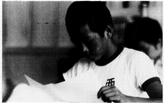
全校授業研究会時の児童のまなざし