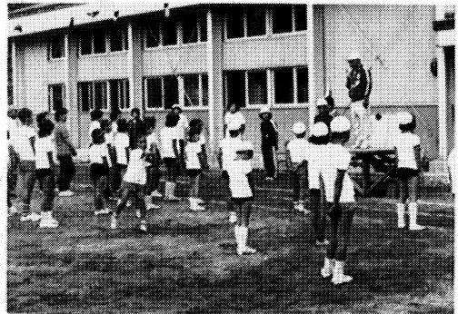
四ツ谷・高森分校合同運動会

スの面を生かすべく、すべての教育活動・研修・運営・管理等に努力している。ただ現実に従うだけでなく、児童の真の幸せを求めて、一步一步前進を心がけて、地区民と一体となって苦心していることは申すまでもない。 過疎地にも容赦なく押し寄せる生活面での都市化の波の中で、心身ともにたくましい児童にどのようにして育て上げるか、最も腐心しているところである。幸い二十歳代の教師が五七%いる。このエネルギーを中心にして全職員精進している。