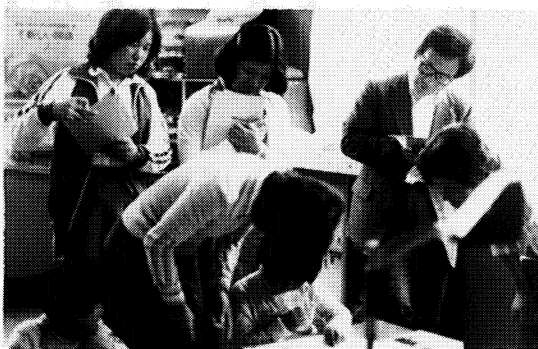
琵琶首分校授業研究会に集まった青年教師