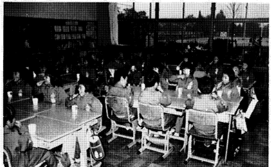
給食後レコードに合わせて「歯みがき体操」

学習訓練の徹底、児童活動の強化、業間活動のくふう、愛校活動の充実、対外活動への積極的参加等を通して、健康で意欲的な児童の育成を旨ざし、全児童、全職員が、「光る一線」に立つてこれからも努力していきたいと思う。