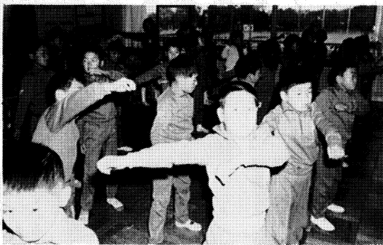
雨天時の室内業間体操

意欲的な学習活動を展開していくためには、積極的な参加の意欲を喚起し、主体的な児童活動をなおいっそう重視して指導していく必要があると考え、そのための方策も合わせて研究中である。