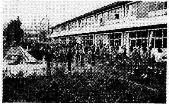
全校いっせいに「目の体操」

本校は、白河市と矢吹町に隣接した児童数二百五十二名、職員数十六名、学級数九の、小規模農村校である。過去二年間、県教育委員会指定の研究校として学校保健・給食の実践研究に取り組み、「心身ともに健康な子ども」を旨とし一貫して努力してきた。健康がすべての教育活動の基盤になるものと考え、学校教育目標にも「健康即教育」の観点から、「健康を旨ざしてがんばる子」をその第一に掲げ、実践指導の強化を図ってきた。その結果は、二