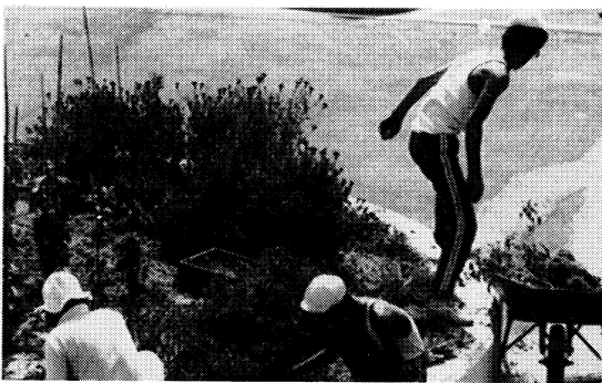
心をこめて花だんの手入れ

上に、教師と生徒、地域・家庭が一丸と なつて取り組み、学力の向上では自主 的学習態度の育成を目ざして継続研究 を重ね、生徒は「学習の手引」に基づ いて学習計画を立て、教師の授業充実 と相まつて一人一人の学力の向上に努 めている。 今年の二か年にわたり、「地域ぐる みの道徳教育研究」に文部省指定を受 け、道徳の授業の充実、生徒の自主的 活動、地域と家庭の理解と協力を基に