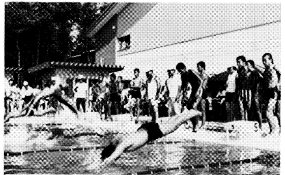
全校皆泳をめざし夏にきたえる

道徳的実践力の育成に努めている。 実践活動については、各教科はもちろ ん、生徒会の自主的活動の促進、J R Cのボランティア活動の活発化を図つ ている。 「事故のない学校、住みよい学校、 力のつく学校」を目標に全職員一丸と なっている折、J R C活動優良校とし て全国表彰の栄誉を受け、道徳教育の 一環としてますますこれを伸ばしてい きたいと願っている。