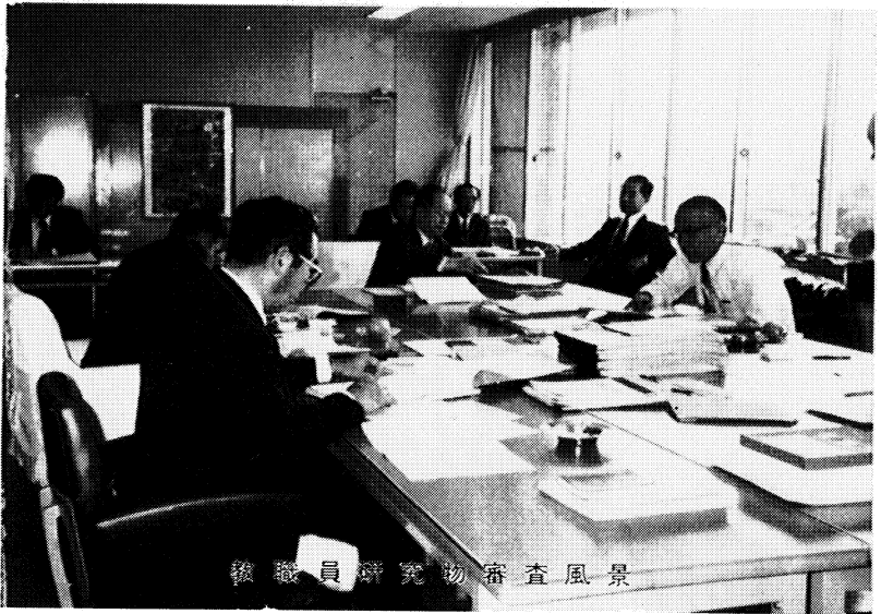
教 職 員 研 究 物 審 査 風 景

児童生徒一人一人が、学校における教育活動の中でよりよい成長を遂げ、変容していくためには、児童生徒とともに教師自身自己変革(自己向上)を実践していくことがたいせつなことです。 このためには、専門職としての教師のあり方を再認識し、一人一人の教師が自発性・創