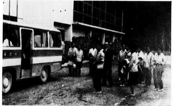
みどり号の巡回風景（昭和41年）