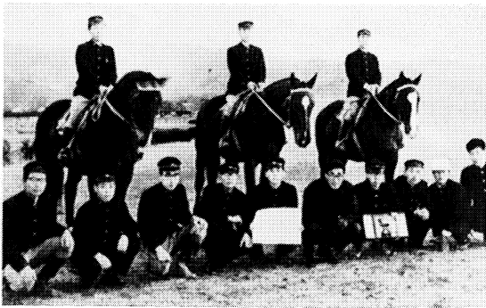
福島商業高校馬術クラブ（昭和37年）