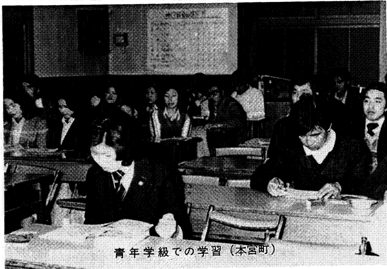
青年学級での学習 (本宮町)