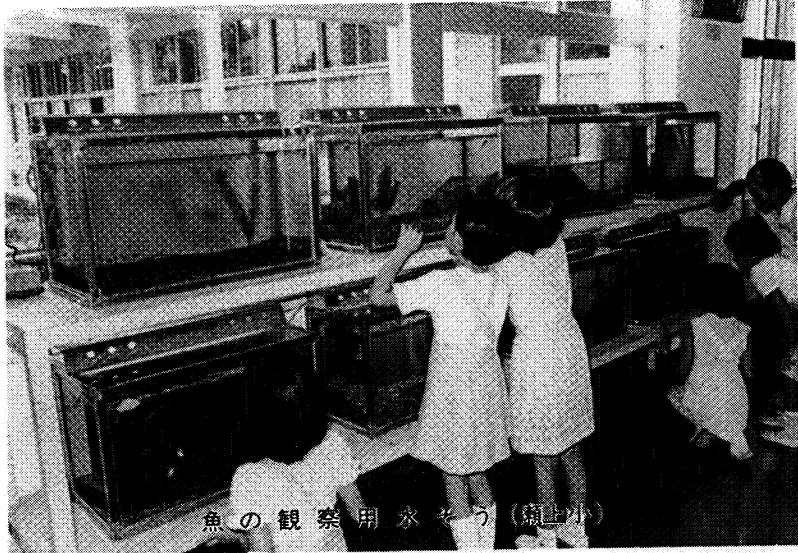
魚の観察用水そう (瀬上小)

学校教育では、例えば、幼稚園の地域別就園率の不均衡是正、小中学校の学校規模・配置