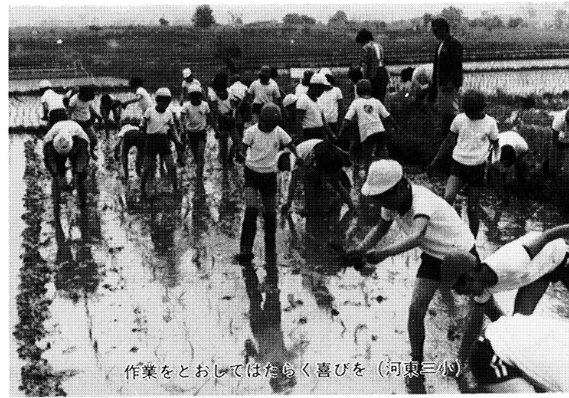
作業をとおしてはたらく喜びを (河東三小)