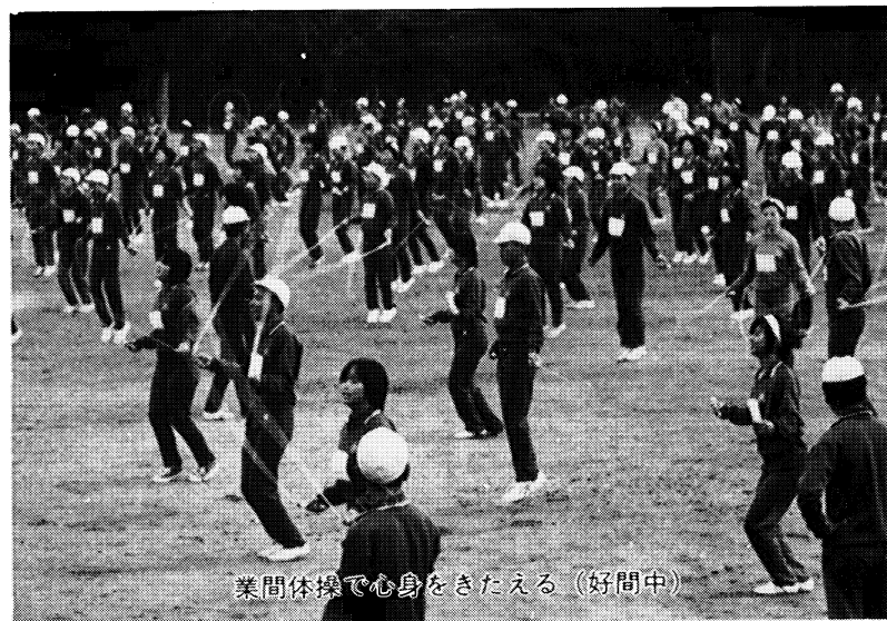
業間体操で心身をきたえる (好間中)