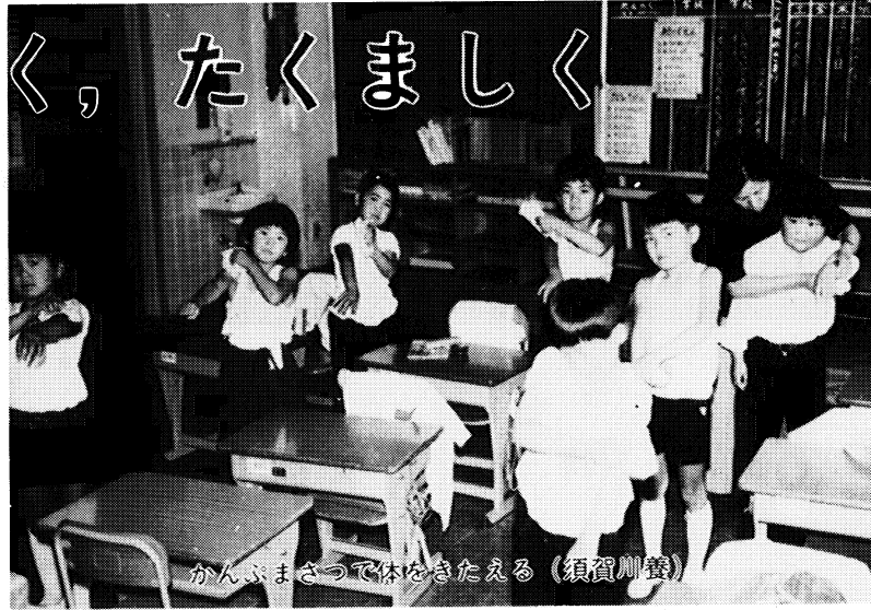
かんぶまざつで体をきたえる (須賀川養)