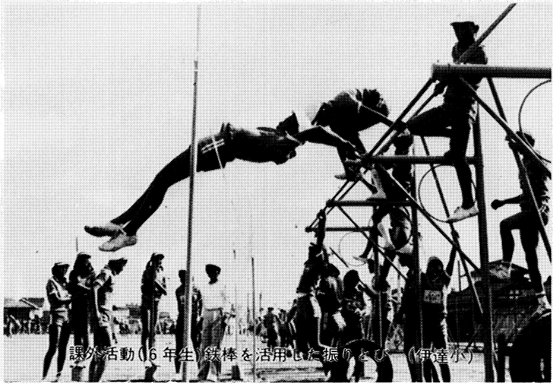
課外活動(6年生)鉄棒を活用した振りとり(伊達小)