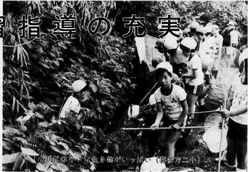
「小川には小さな生き物がいっぱい」(喜多方二小)