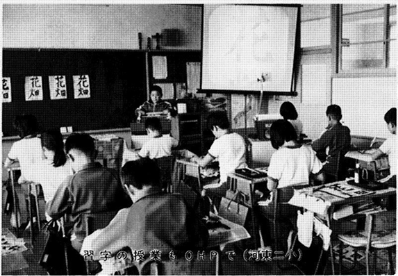
習字の授業もOHPで(河東二小)