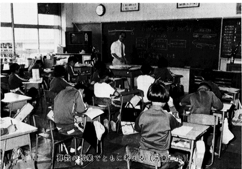
算数の授業でともに考える（河東二小）

また、高等学校においても、本年六月に新しい学習指導要領案が文部省より発表されたところです。 なんとといっても、学習指導の効果をあげるためには、各学校における自発的・創造的な活動に期待するところが大きいものです。 各学校においては、指導内容の精選を図り、教材・教具の改善や学習評価の研究を積極的に進め、一人一人の児童生徒の個性や、能力・適性に応じて確実に内容を身につけてやることがたいせつです。