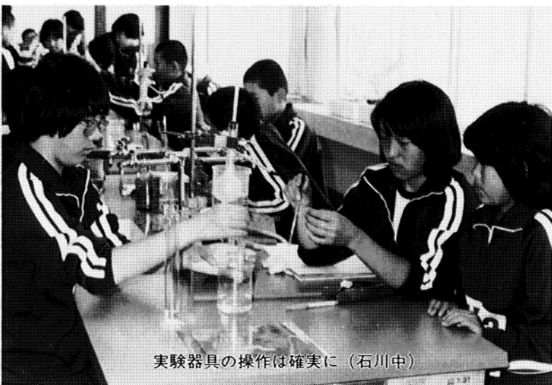
実験器具の操作は確実に（石川中）

また、高等学校においても、本年六月に新しい学習指導要領案が文部省より発表されたところです。 なんとといっても、学習指導の効果をあげるためには、各学校における自発的・創造的な活動に期待するところが大きいものです。 各学校においては、指導内容の精選を図り、教材・教具の改善や学習評価の研究を積極的に進め、一人一人の児童生徒の個性や、能力・適性に応じて確実に内容を身につけてやることがたいせつです。