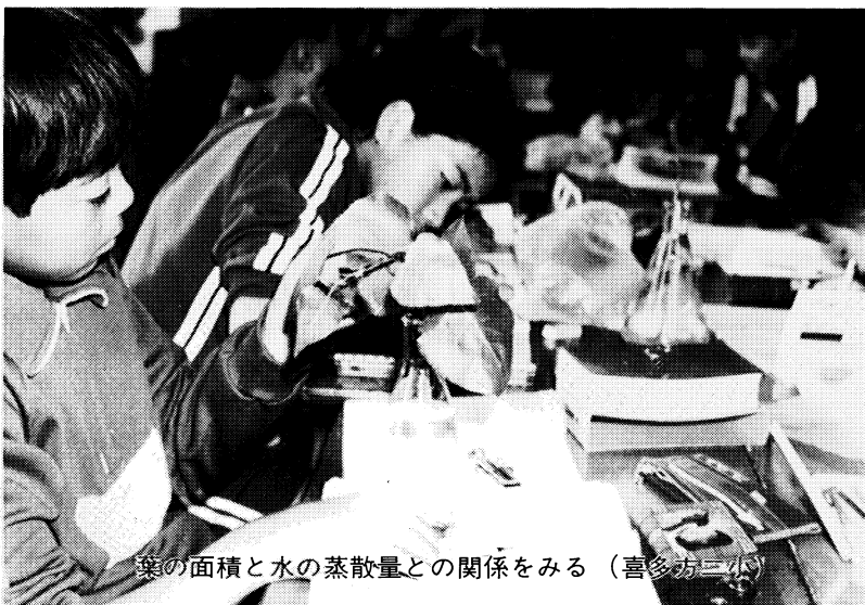
葉の面積と水の蒸散量との関係を見る（喜多方三小）