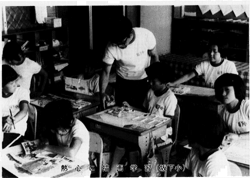
熱心に描画学習 (坂下小)