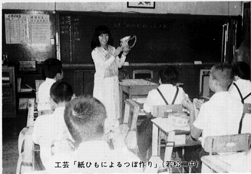
工芸「紙ひもによるつぼ作り」(若松二中)