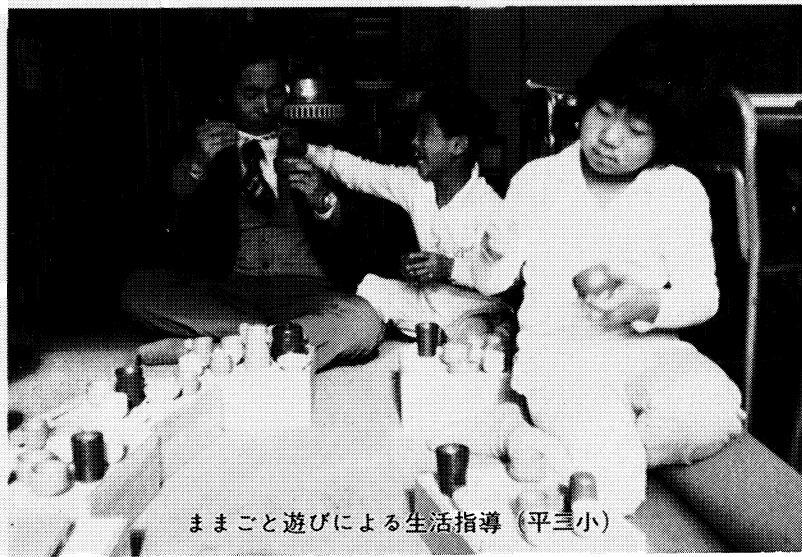
ままこと遊びによる生活指導 (平三小)