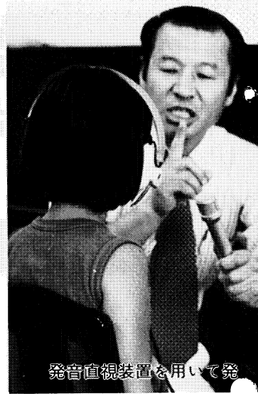
発音直視装置を用いて発