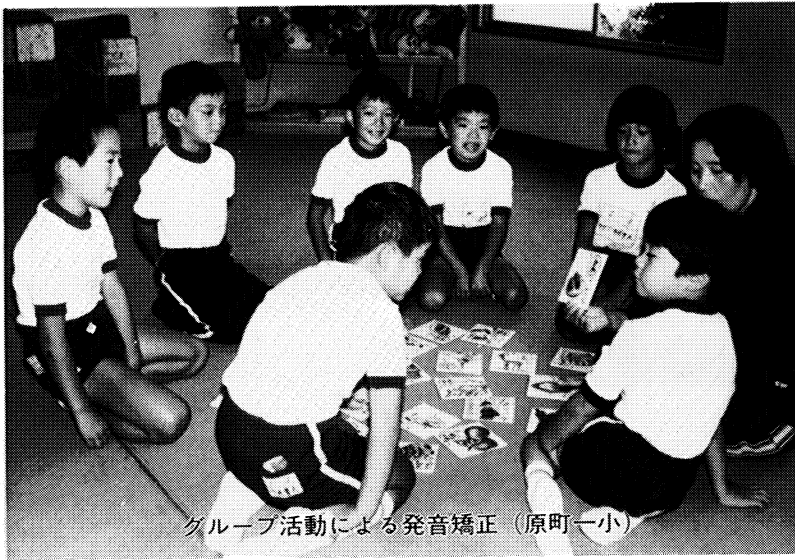
グループ活動による発音矯正（原町一小）