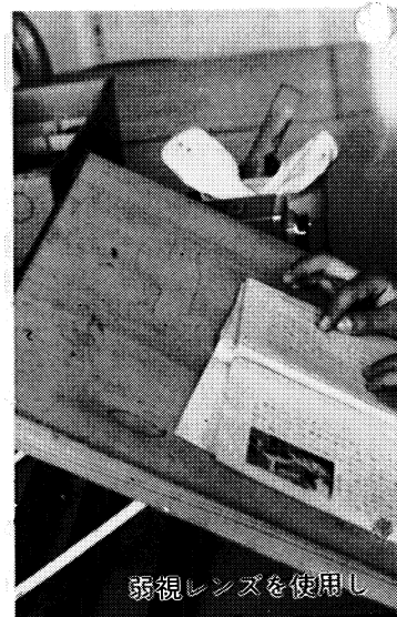
弱視レンズを使用し

○小・中学校の一般の学級における教育との関連 ○義務制化後における特殊学級のあり方 などいろいろな課題があり、これらの改善には いったいその努力が必要です。 さしあたり、就学指導に当たっては、市町村 の教育委員会はもとより各学校にあっても、そ れぞれ障害の種別に応じ適正な就学指導に努め るとともに、慎重に対処していただきたいと思 います。