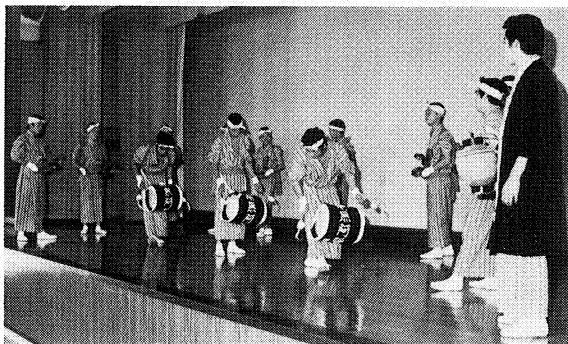
じゃんがら念仏踊の練習

農業のあり方について論議をかわしている現今にあつても、一貫した近代的農業人の育成に終始変わらぬ教育活動を力強く続けている。