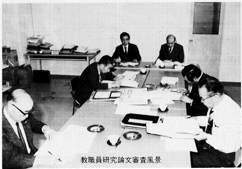
教職員研究論文審査風景