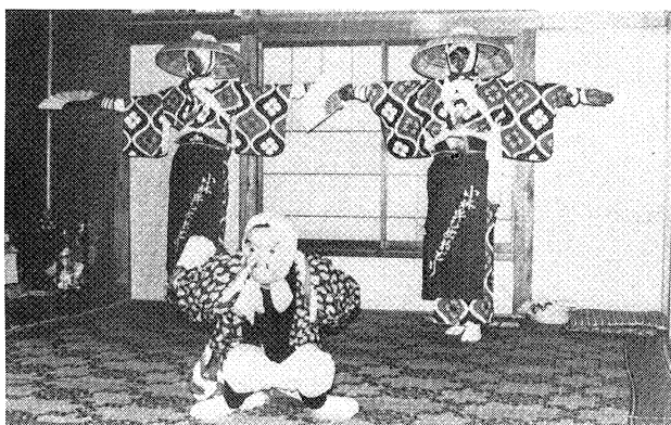
▲小林の早乙女踊 南会津郡只見町