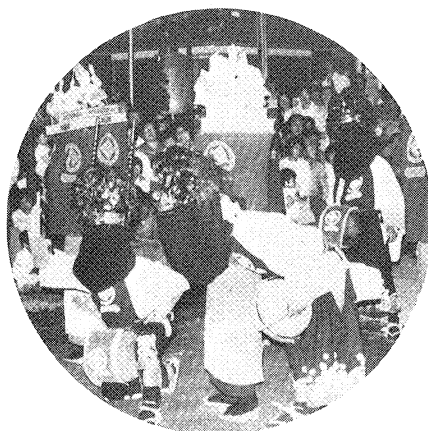
▲栗生沢の三つ獅子 南会津郡田島町 (県指定重要無形民俗文化財)