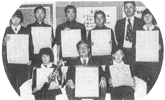
統計グラフコンクールで優秀学校賞受賞

益金二十二万円を活動費にあて、勤労を愛する心を育て、父母負担の軽減を図っている。また例年一月中旬に校内百人一首カルタ大会を開き、古典に親しませている。父母も学習に熱心で、PTA大学を開設して学習に励んでおり、昭和五十三年度は、県と東北連Pから、優良PTAとして表彰された名実ともに、今や地域ぐるみの教育に発展している。