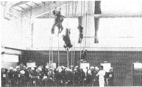
体力づくりプランによる全校体育

学習面ではプログラム学習を導入し授業の充実を図っている。その成課として高校進学二年連続百パーセント合格、また各種コンクールに昨年は八十一名の入賞者を出し、県統計グラフコンクールで優秀学校賞、防犯ポスターは東北で一、二、三位独占、交通安全隊で優良学校賞等、五つの学校賞を受賞、スポーツと学業の両立に努めている。生徒会活動も活発で全校生によるフキ採集の収